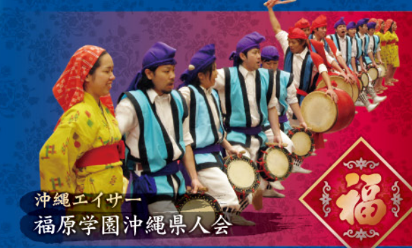
沖縄エイサー 福原学園沖縄県人会