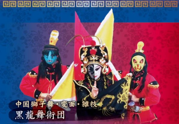
中国獅子舞・変面・雑技 黒龍舞術団