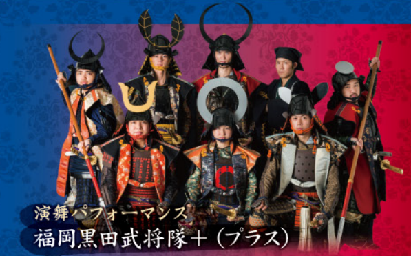
演舞パフォーマンス 福岡黒田武将隊+ (プラス)