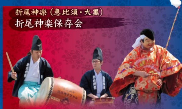
折尾神楽 (恵比須・大黒) 折尾神楽保存会